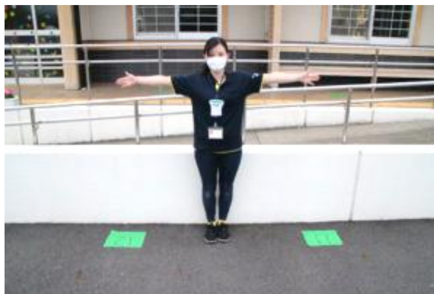
●外でも中でも「安心の距離を」