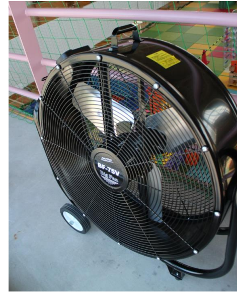
●エアコン 常時送風ON ●巨大 サーキュレーター