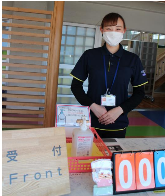
● マスク着用 と 応対時の配慮