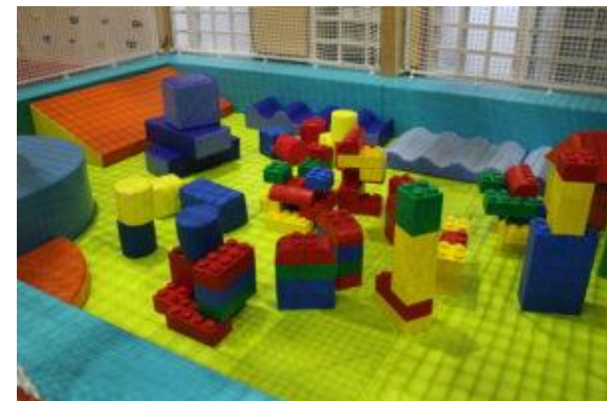
● ボールプールは お休みに